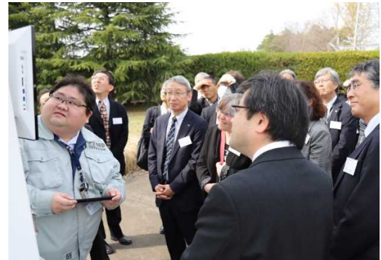
レーダーによる雲の観測の説明