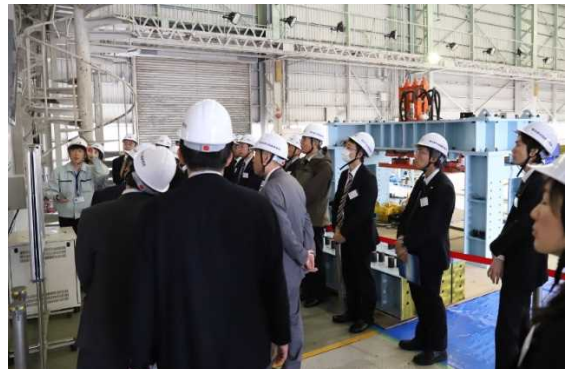
大型耐震実験施設の説明