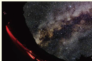
「僕らを見下ろす天の川」 染野 理