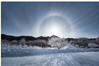
「寒とハロ」 林 巧