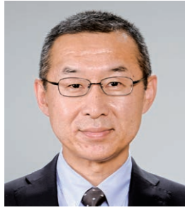
筑波研究学園都市交流協議会 会長 (国土交通省国土技術政策総合研究所 所長)